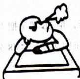
遇困难——泄气的皮球