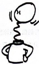
受表扬——飘起的气球